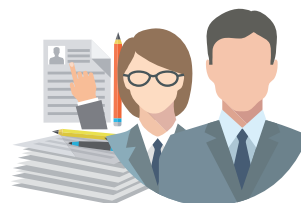
「技術・人文知識・国際業務」

その他、許可される可能性が高い活動としては研究・開発・システムエンジニア・プログラマー・商品企画・スーパーバイザー・経理・法務・マーケティング・広報・設計・マネージメント・人事・営業・経営企画・生産管理・品質管理等が挙げられますが、業種・業態・事業規模等によっても許可の取りやすさに違いが出ることもあります。